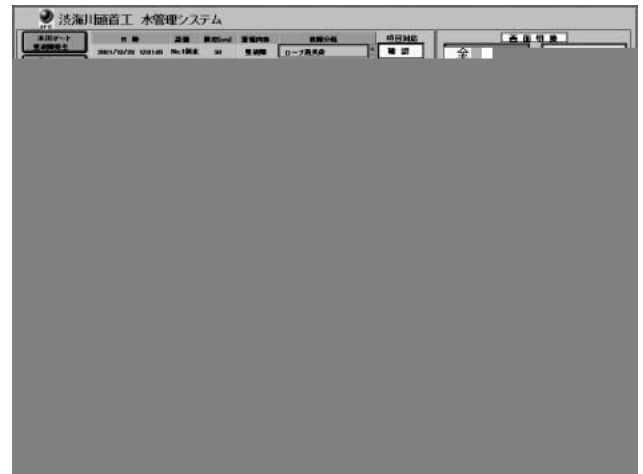
Fig.2 Operation screen